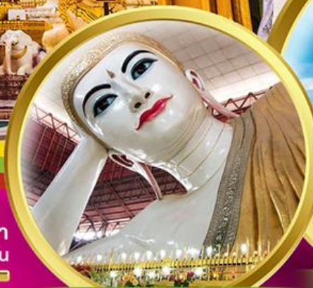
พระนอนตาวาน