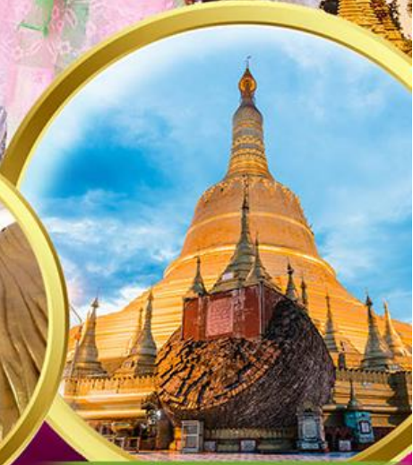
เจดีย์ชเวมอดอร์

พิเศษ!! กุ้งแม่น้ำเผาท่านละ 1 ตัว + บุฟเฟต์HOTPOT